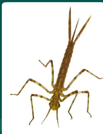
LARVE VAN DE WATERJUFFER