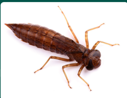
LARVE VAN DE LIBEL