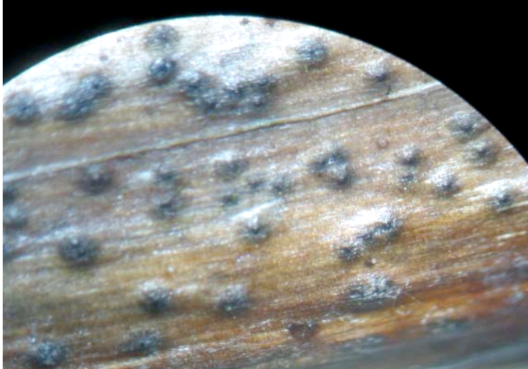
Wilgenroosjeskogelzwam - discostroma tostum