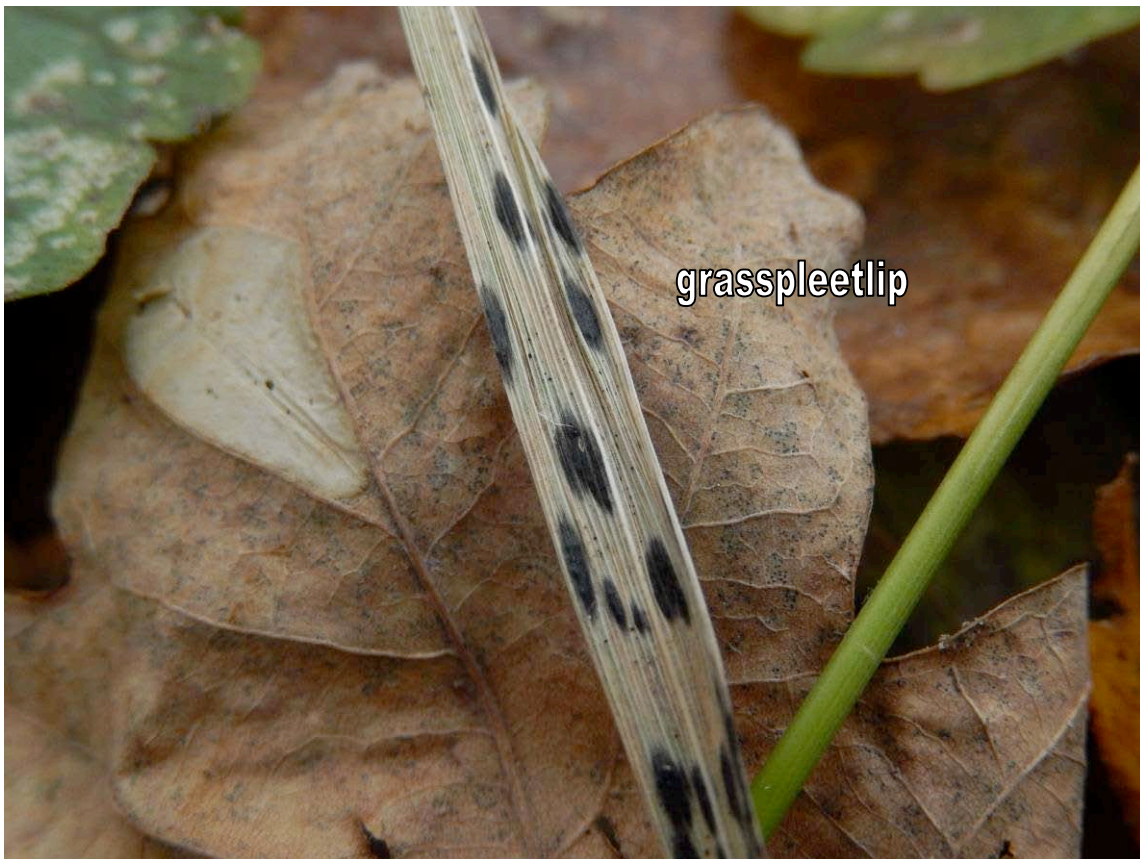
Kromsporige mollisia - Mollisia caricina

Pijpenstrootjesspleetkooltje - Gionella mollina grasgeleikelkje - Cyathicula airae Getand grasgeleikelkje - Cyathicula dolosella Viltig geleikelkje - Cyathicula tomentosa Pijpenstromollisia - Cejpia hystrix Grootsporig vlieskelkje - Hymenoscyphus suspectus Helmdekselbekertje - Hysterodtegiella valvata Lachnum nardi Teer franjekelkje - Lachnum tenuissimum Slijmspoorspleetlip - Lophodermium culmigenum Grasspleetlip - Lophodermium gramineum