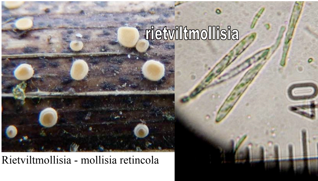
Rietviltmollisia - mollisia retincola

Donkere lisdodemollisia - mollisia typhae Liesgrasknoopje - ombrophila ambigua Vleeskleurig franjekelkje - perrotia distincta Rietkraagkultje - Phragmiticola phragmitis Witbolfranjekelkje - psilachnum acutum Grasschotelkje - psilachnum eburneum Moerasstromakelkje - rutstroemia lindaviana Arthrobotrys elegans anamorfe Rechtsporig wasbekertje - orbilia rectispora Gedeeldsporig wasbekertje - orbilia septispora Spiraalspletig schoorsteentje - anthostomella limitata lisdodde Zeggeschoorsteentje - anthostomella tomicoides Graszoolspootje - arthrinium arundinis Buergenerula typhae Gekraagd piekhaartnetje - ceratostomella mirabilis lisdodde Antenneharig kwastkopje - chaetomium elatum Echt moederkoren - Claviceps purpurea Dinemasporium strigosum Gragitklompje - gibberella zeae Rietsierspoorkogeltje - halosphaeria hamata Magnisphaera spartinae Ingebed meniezwammetje - nectriella dacrymycella Grasknikkertje - phomatospora dinemasporium Banaansporig tepelkogeltje - rosellinia nectroides Hymenopsis typhae Microdiscula phragmites anamorfe