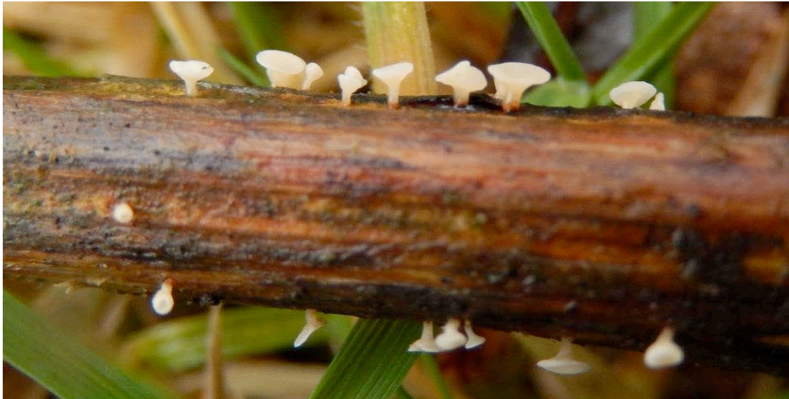
Gewoon geleikelkje – Cyathicula cyathoidea